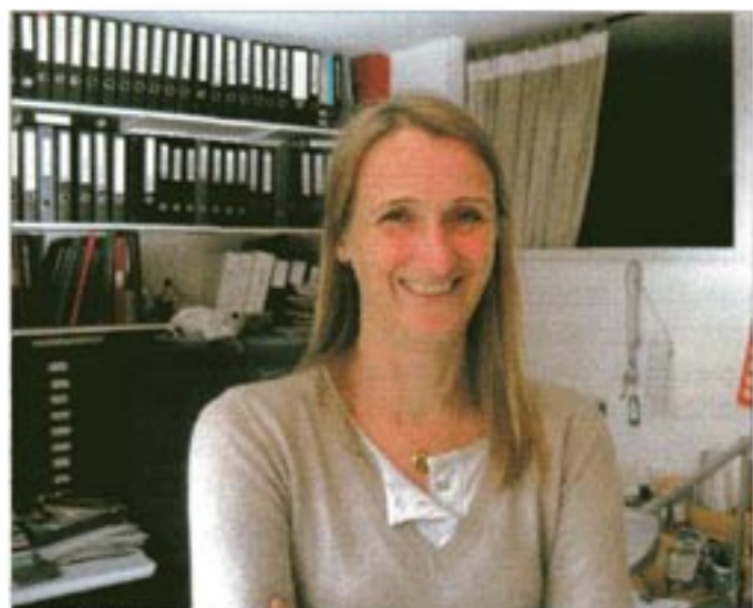
LUCY ORTA.

In späteren Arbeiten beschäftigte sich die Künstlerin mit alternativen Systemen für mehr Gerechtigkeit bei der Nahrungsmittelverteilung, mit dem Problem der öffentlichen Meinungsumfragen und dem sogenannten Lobbying. Die Tatsache, dass Bauern in den EU-Länder trotz weltweiter Hungersnöte jährlich Millionen Tonnen von frischen Agrarprodukten vernichten müssen, um im internationalen Wettbewerb bestehen zu können, regte die Künst-