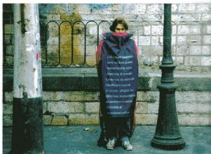
LUCY ORTA, Refuge Wear City Interventions 1993-1996, Original Lambda Farblitografie, 9teilig, 200 x 290cm (6 0x 90cm jedes)