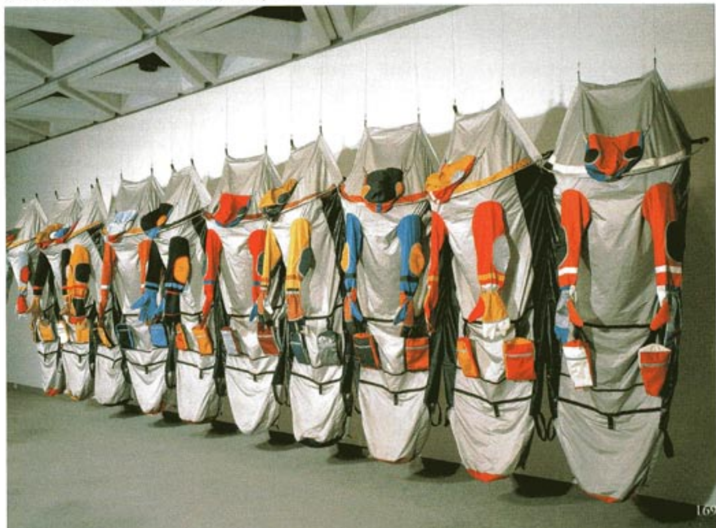
LUCY ORTA, Modular Architecture - The Unit x 10; Mikroporöses Polyester, diverse Textilien, Reißverschlüsse, teleskopische Aluminiumstruktur, 210 x 1000 x 50cm, 1996, Kollektion Lucy Orta

Probleme zu lösen. Es ist aber dringend nötig, gewisse Phänomene aufzuzeigen, um eine offene Debatte darüber zu ermöglichen, die, wie ich hoffe, so viele Menschen wie möglich anspricht. Die Workshops, die Aktionen, Interventionen und Konferenzen, welche ich in den letzten Jahren organisierte, sind Möglichkeiten, die sehr divergierende Öffentlichkeit mit dem zu konfrontieren, was sie nicht sehen will. Es handelt sich um interdisziplinäre Kollaborationen zwischen Kindern, Studenten, Lehrern, Sozialarbeitern, Architekten, Philosophen. Die Kommunikation kann Barrieren überwinden. Erfahrungen wie Nexus Architecture bei der Biennale in Johannesburg bestätigten, dass es möglich ist, in der Form zusammenzuarbeiten. Alles in allem interessiert mich Mode als soziales und kulturelles Phänomen und, wenn ich mit Kleidung arbeite, so hinterfrage ich diese Begriffe. Im Hinblick auf die Lebensphilosophie liegen Mode und Kunst ideologisch vollkommen auseinander, was nicht heißt, dass ich keinen Respekt für Designer und für die Denker habe, die Mode als Disziplin begreifen. Ich war sehr überrascht, als ich die Nominierung für einen Lehrstuhl an dem College of Fashion in London erhielt, aber ich finde es enorm wichtig, über die Modeindustrie nachzudenken. Und hoffe auf die Erweiterung der Wahrnehmung im Bereich der Mode als akademisches Thema und als multidisziplinäre kreative Industrie, und ich erwarte einen rigorosen, dis-