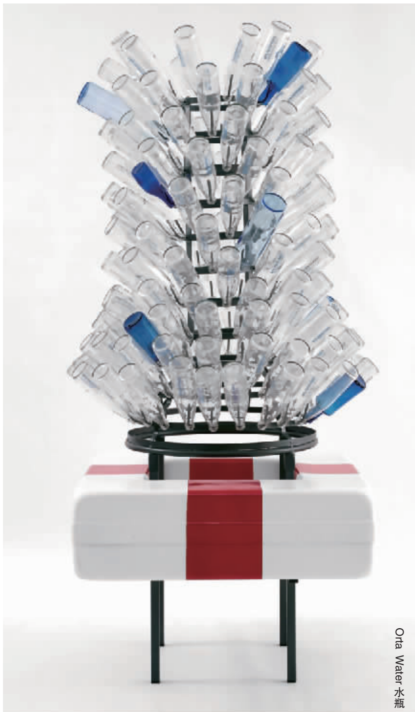
(上接 D01 版)

“不管是威尼斯的大运河、阿姆斯特丹的运河、还是上海的黄浦江，大家看到的第一个想法肯定不是探下头去喝水，因为它们看起来真的很脏。把河水净化成饮用水，其实并不像大家想的那样复杂。”露西说，“我们开始的时候还担心找不到合适的工程师，但很快就找到了人选。这个装置其实告诉我们很简单的一个道理，但是也会引发我们对水的讨论。”露西使用江浙地区的竹子作为材料制作水箱，架在两米高的地方，然后从离展厅仅有 20 米的黄浦江当中取水，经过净水装置处理，变成可以直接饮用的净水，所有观众都可以尝一下这件装置的“产品”。