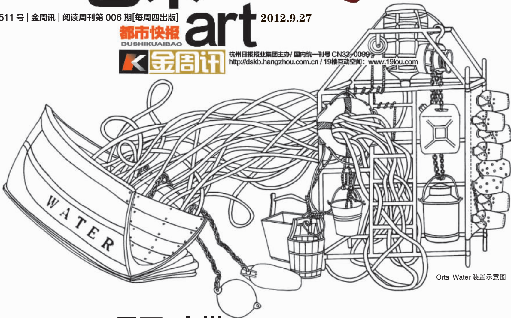
Orta Water 装置示意图

杭州日报报业集团主办 / 国内统一刊号 CN33-0099 / http://dskb.hangzhou.com.cn / 19楼互动空间: www.19lou.com