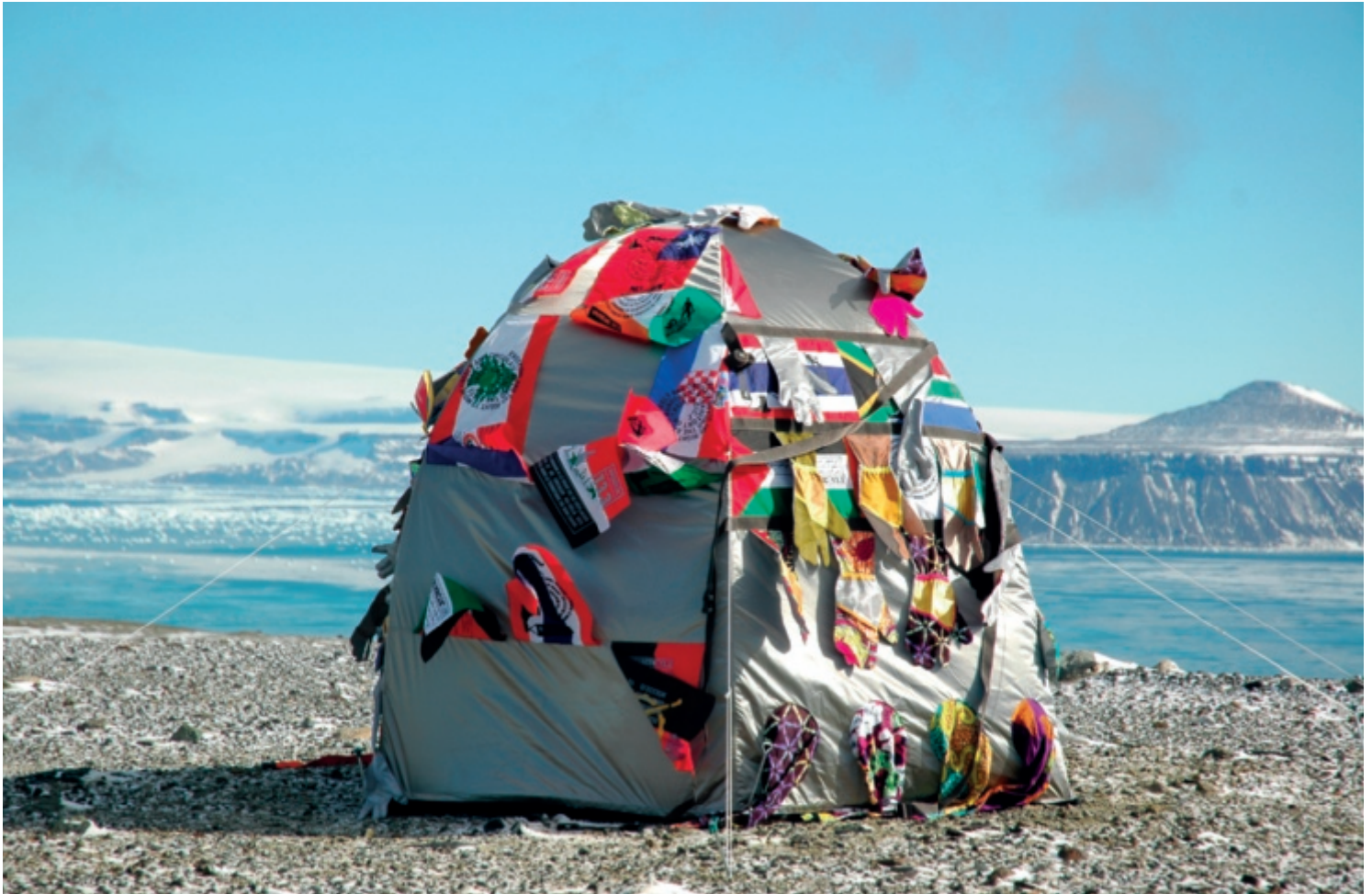
Ci-dessus, Antarctic Village – No Borders (2007), de Lucy + Jorge Orta.