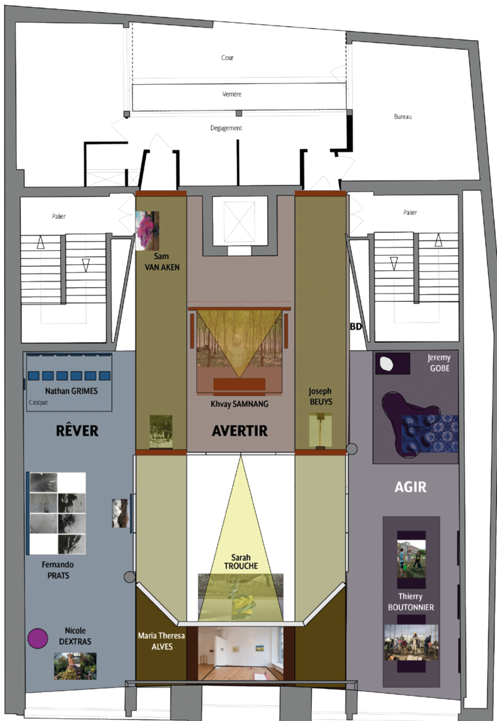
Niveau 2 (1 e étage)