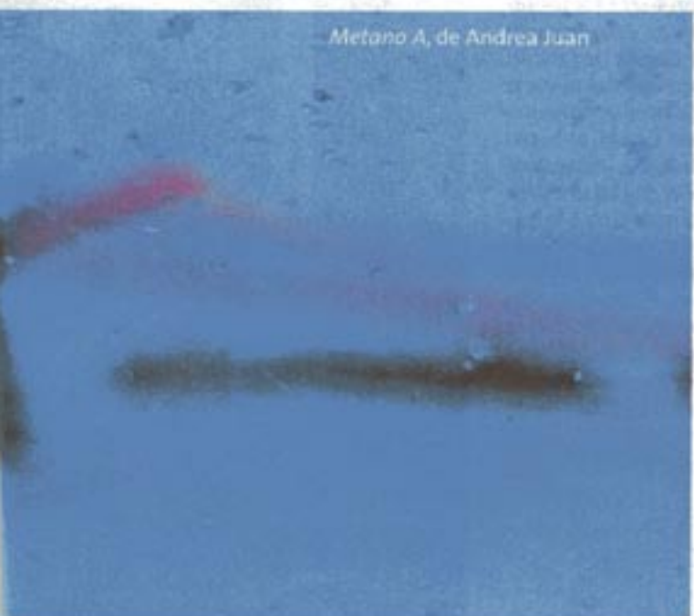
Metano A, de Andrea Juan

Como una contribución al Año Polar, la Bienal del Fin del mundo congrega a artistas de 17 países para que expresen un mensaje ambientalista ligado al cambio climático. Hasta fines de abril, la ciudad de Ushuaia está intervenida con el arte.