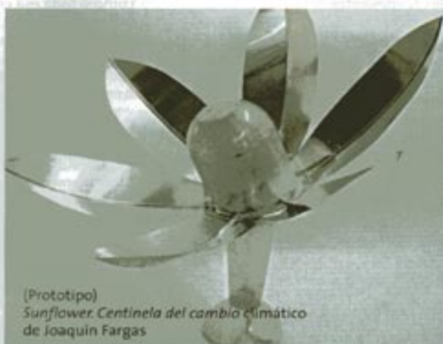
(Prototipo) Sunflower. Centinela del cambio climático de Joaquin Fargas