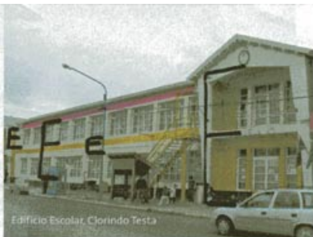
Edificio Escolar, Clorindo Testa