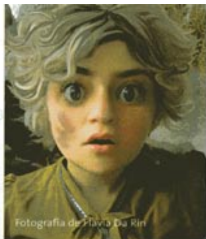
Fotografía de Flavia Da Rin

de la cátedra Rootstein Hopkins of Fashion, London College of Fashion, University of the Arts, Londres), presentan una instalación compuesta por carpas, bolsas de dormir, banderas e inscripciones serigrafadas de la Declaración Universal de Derechos Humanos de 1948, que pretende ser un territorio simbólico que acoga a toda la humanidad. Entre los participantes extranjeros Kcho –apodo por el que se conoce al mundialmente célebre artista cubano Alexis Leyva Machado–, preparó una intervención para la Casa Beban, traída íntegramente desde Noruega en 1904 y uno de los espacios más tradicionales de la ciudad. Eija-Liisa Ahtila, de Finlandia, el controvertido artista español Santiago Sierra, cuya obra se caracteriza por su alto contenido de provocación; el colectivo Bijari, de Brasil, y el grupo canadiense BGL que presentó La Guerra del Fuego , entre otros más para quienes también arte, tecnología y medioam-