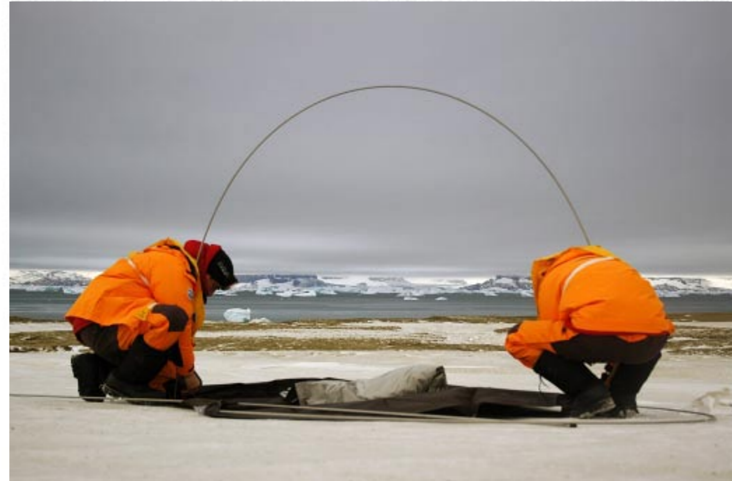
Lucy + Jorge Orta Antarctic Village - No Borders 2007

Un continente senza bandiera, libero da conflitti e dallo sfruttamento delle risorse. Un non luogo, dall'ecosistema rarefatto ma inviolato, in cui l'uomo rimane irrimediabilmente ospite. L'Antartide è una risorsa mentale per tutti coloro che si sentono vessati da quanto accade nel resto del mondo. Ma anche una straordinaria risorsa creativa per gli artisti Lucy + Jorge Orta che dal 3 aprile all'8 giugno espongono all'Hangar Bicocca di Milano gli interventi realizzati nella primavera del 2007 nel corso di una spedizione al Polo Sud. Come le 25 tende installate in Antartide che costituivano Antarctic Village/No Borders , i Paracadute a goccia , gli Equipaggiamenti da sopravvivenza e il video della loro appassionante esperienza.