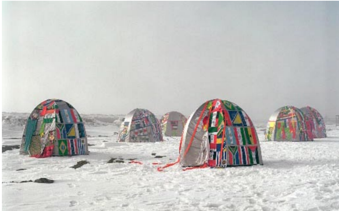
Lucy + Jorge Orta Antarctic Village - No Borders 2007