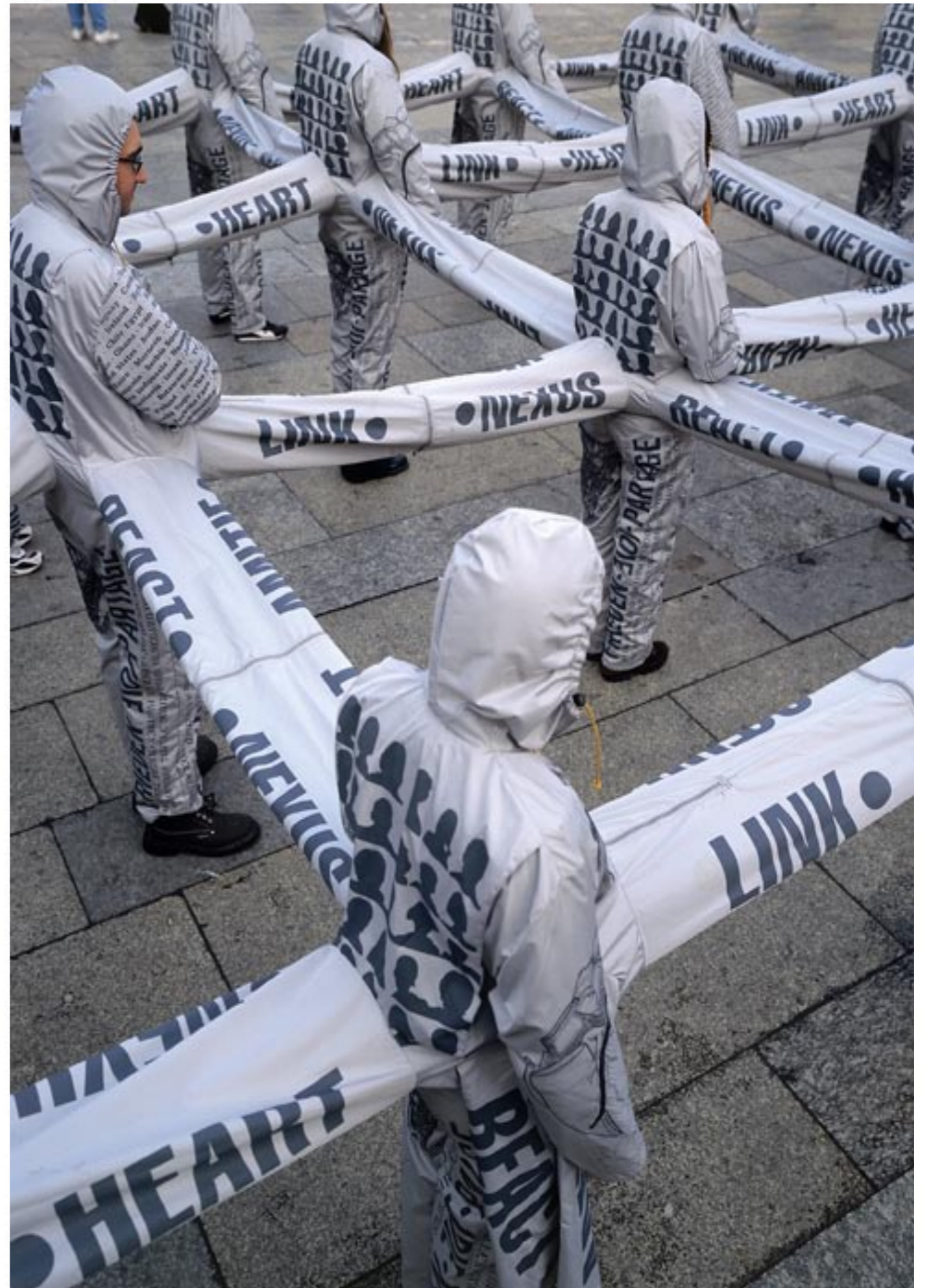
Lucy Orta M.I.U. VII - Nomad Hotel 2003