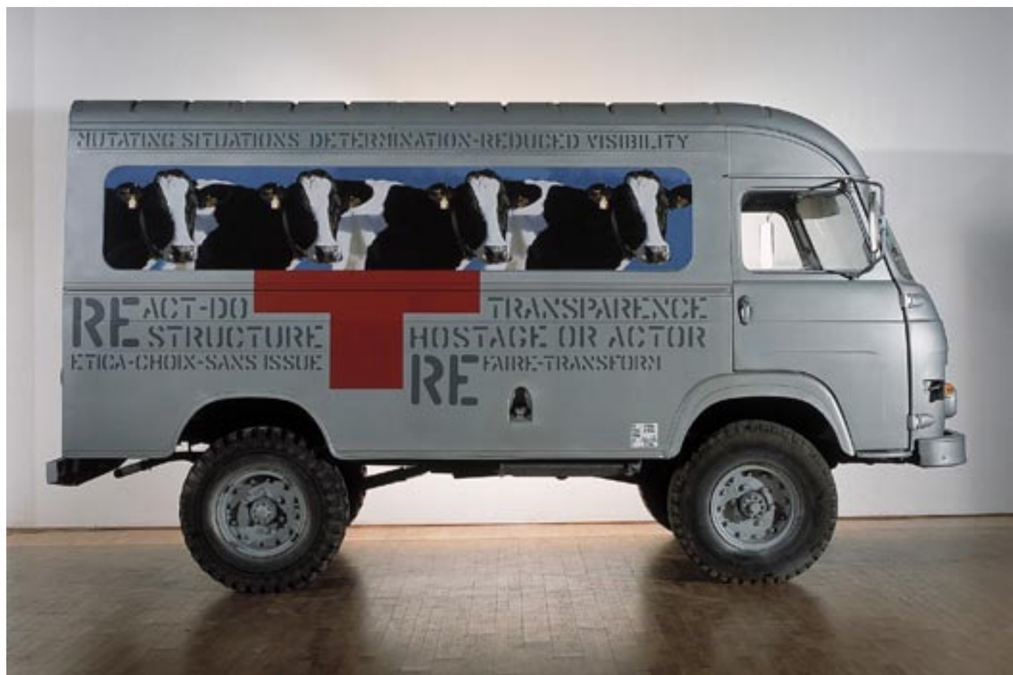
Lucy Orta Nexus Architecture x SU 2001