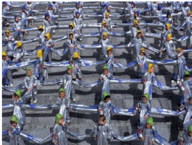
Intervention with 110 children from the town of Cholet. Lucy Orta.

months in order to carry out a number of activities of considerable aesthetic level and of a great social impact. For years, the two authors have been dedicated to studying social and environmental issues, analysing nomadic living structures. Starting from a pacifist slogan "another world is possible" and from their research into modular thermal architecture, the Orta created a series of 25 tents-refuges in order to form a small village on ice. This was achieved by using flags from all over the world, clothes, pieces of cloth and consumables, on hand-printed membranes decorated with texts taken from the Declaration of Human Rights. As is known, the Antarctic ecosystem accounts for 70% of the Earth's freshwater reserves: the Antarctic Village is therefore a banner for safeguarding of the world in which we live. The projects by Lucy and Jorge Orta are on show at the Hangar Bicocca in Milan until 8th June (catalogue by Electa). A window on a clean horizon, ice, but not only: exportable - we hope - to all latitudes.