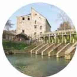
MOULIN LA VACHERIE