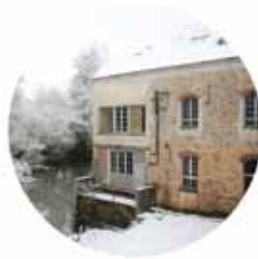
MOULIN DE BOISSY