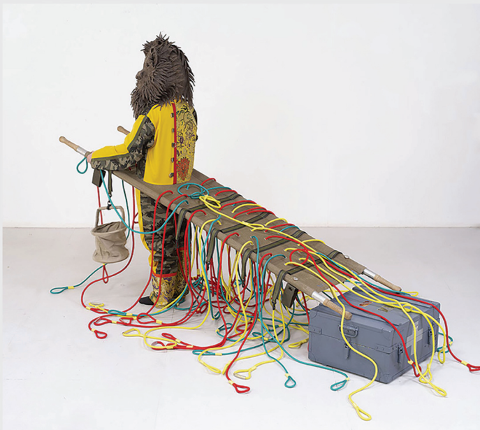
Life Guard [Fuoco] 2019. Foto: Bertrand Huet.

Lucy Orta: Anteriormente mencioné que la pantalla mediaba nuestra relación con el mundo. Considero que el 'arte' que está presente fuera de este mundo virtual, en museos, galerías o en las calles puede desconectarnos de la máquina, para traer nuestros cuerpos al momento presente, para estar más en sintonía con nuestras emociones. No tenemos otra opción o al menos creo que tenemos la obligación de poner el foco sobre aspectos de la realidad que necesitan más atención a través de la creación artística. El poder del arte se basa en que es difícil de aprovechar. Puede ser ambiguo y poético; el arte puede hacernos viajar a otro lugar, también puede conmocionar y agitar, y cada uno de nosotros sentiría algo diferente. En Studio Orta nos interesa la capacidad transformadora de un lenguaje polisémico, un arte que puede interpretarse en diferentes niveles por especialistas y profanos. Muchos de nuestros objetos y esculturas se mantienen cercanos a la realidad porque estamos tratando con temas complejos que necesitan más demostración, como nuestras máquinas de purificación de agua, por ejemplo.