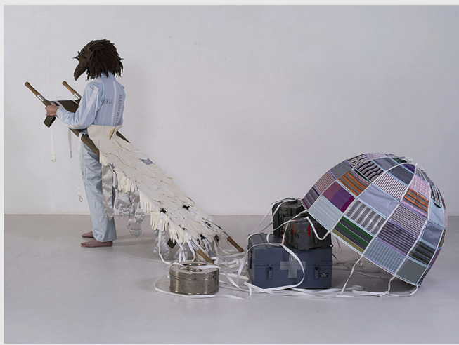
Life Guard [Aira] 2019. Foto: Bertrand Huet.

Quitó las lonas de lino del marco, incorporé vivacs para realzar la noción de protección, inserté overoles para reflexionar sobre la capacidad humana de superar las pruebas, y lo hice para presentar una figura que, de forma simultánea, era cargada y cargaba a alguien ( Life Guard , Curve Gallery, Barbican London, 2005). Utilicé la lona como lienzo sobre el que cosí objetos: cantimploras para llevar agua a alguien sediento ( Life Guard – OrtaWater , 2005), o flores textiles gigantes para evitar que desaparecieran ( Life Guard Amazonia , 2016).