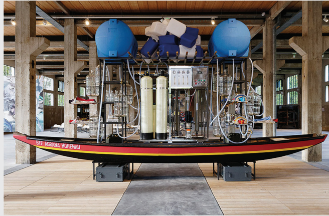
Zille Purification Unit. 2020.

Quitó las lonas de lino del marco, incorporé vivacs para realzar la noción de protección, inserté overoles para reflexionar sobre la capacidad humana de superar las pruebas, y lo hice para presentar una figura que, de forma simultánea, era cargada y cargaba a alguien ( Life Guard , Curve Gallery, Barbican London, 2005). Utilicé la lona como lienzo sobre el que cosí objetos: cantimploras para llevar agua a alguien sediento ( Life Guard – OrtaWater , 2005), o flores textiles gigantes para evitar que desaparecieran ( Life Guard Amazonia , 2016).