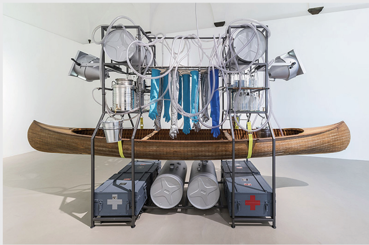
OrtaWater – Fluviale intervention unit. 2005.

En cuanto a nuestras habilidades, nos complementamos muy bien. Jorge tiene formación en las Bellas Artes tradicionales y estudió arquitectura y urbanismo. Su visión es macro, de largo plazo y tiende a desarrollar los planes y aspectos técnicos de los proyectos. Yo trabajo desde la perspectiva de los “materiales blandos” de los textiles y la construcción del cuerpo y la identidad a través de la ropa. También trabajé en previsión, en sintonía con la actualidad y los cambios en los gustos de los consumidores. Contribuyo a la proyección comunicativa y a los aspectos sociales de nuestro trabajo. Ambos estuvimos expuestos a diferentes tipos de injusticias durante nuestros años de formación. Jorge vivió un régimen dictatorial en Argentina en los años 70, y por otro lado, mi madre era trabajadora social en la ciudad de Birmingham, en el Reino Unido, en los años 80 y esto ha dejado huellas que no podemos ignorar. Ambos compartimos la necesidad de crear arte como una forma de andamiaje para los problemas sociales a los que se enfrentan muchos proyectos. Este cadalso es una estructura poética pensada para que la gente se suba y desde la que todos podamos ayudar a fortalecernos y construir juntos.