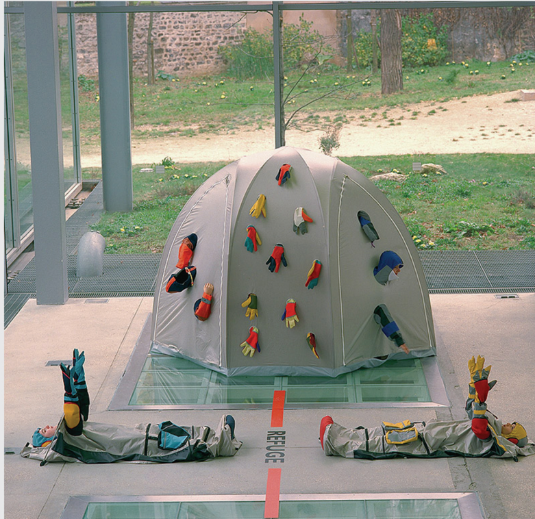
Modular Architecture – The Unit x 10 and The Dome, performance. 1996.

Ataúdes de nailon, moda para refugiados, kit de supervivencia para el nómada moderno o chaquetas que se transforman en tiendas de campaña son algunas de las piezas con las que Orta plantea problemáticas sociales y medioambientales contemporáneas. Sus instalaciones se sitúan entre el arte, la moda y la arquitectura y aunque algunos de sus trabajos han sido expuestos en museos e instituciones de prestigio, el espacio público suele ser el preferido para representar algunos de sus obras más importantes como Antartica , Amazonia o Nexus Architecture .