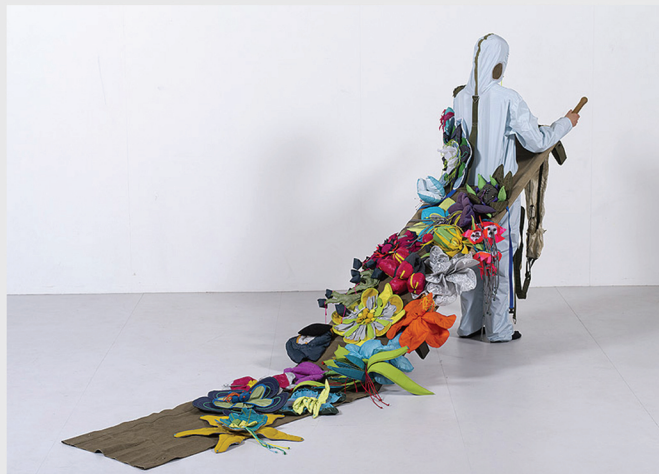
Life Guard Amazonia 2016-2017.