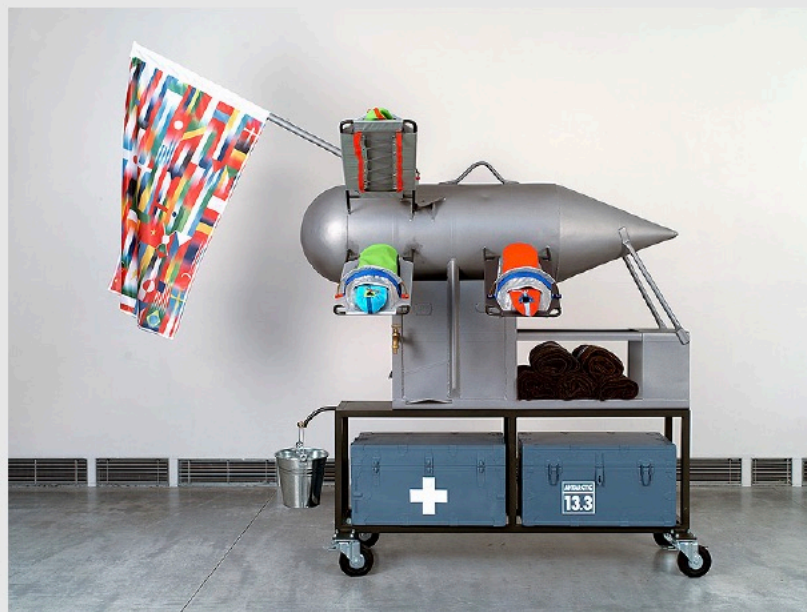
Life Raft / Balise de Vie 2014.