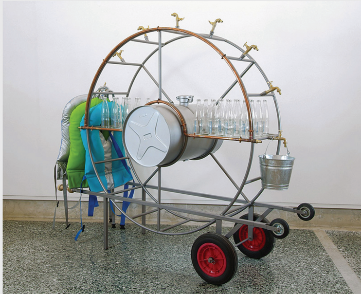
OrtaWater – Portable Water Fountain. 2005.

En cuanto a nuestras habilidades, nos complementamos muy bien. Jorge tiene formación en las Bellas Artes tradicionales y estudió arquitectura y urbanismo. Su visión es macro, de largo plazo y tiende a desarrollar los planes y aspectos técnicos de los proyectos. Yo trabajo desde la perspectiva de los “materiales blandos” de los textiles y la construcción del cuerpo y la identidad a través de la ropa. También trabajé en previsión, en sintonía con la actualidad y los cambios en los gustos de los consumidores. Contribuyo a la proyección comunicativa y a los aspectos sociales de nuestro trabajo. Ambos estuvimos expuestos a diferentes tipos de injusticias durante nuestros años de formación. Jorge vivió un régimen dictatorial en Argentina en los años 70, y por otro lado, mi madre era trabajadora social en la ciudad de Birmingham, en el Reino Unido, en los años 80 y esto ha dejado huellas que no podemos ignorar. Ambos compartimos la necesidad de crear arte como una forma de andamiaje para los problemas sociales a los que se enfrentan muchos proyectos. Este cadalso es una estructura poética pensada para que la gente se suba y desde la que todos podamos ayudar a fortalecernos y construir juntos.