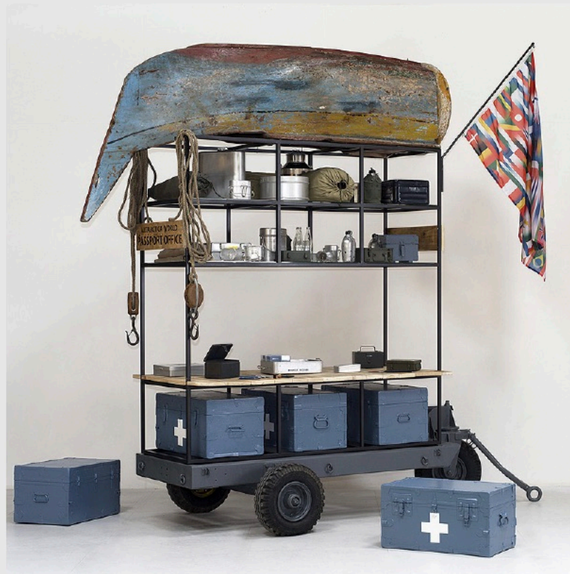
Antarctica World Passport Office, Frieze Projects, 2017.

En "Utopía" destacaremos los problemas y desafíos relacionados con la escasez de agua potable en el mundo mediante la presentación de la Unidad de Purificación Zille , que forma parte de la serie OrtaWater . Consiste en un barco fluvial equipado con una máquina depuradora que investiga los ciclos del agua.