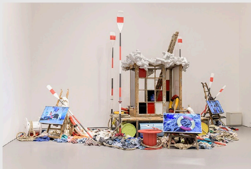
Antarctica | Raft of the Medusa. 2013.

La extrema fragilidad del material como metáfora del proyecto Amazonia hizo que esta obra fuera más poderosa aún; un recordatorio de que las especies también son muy frágiles y están desapareciendo a un ritmo alarmante. Una semilla que es imperceptible para el ojo humano adquiere un nuevo significado en el medio del vidrio. Dentro de cada objeto hay un mundo de vida, atrapada por capas de vidrio fundido transparente y opaco fusionado bajo un intenso calor. La obra surge de las llamas como un recuerdo de la creación del universo.