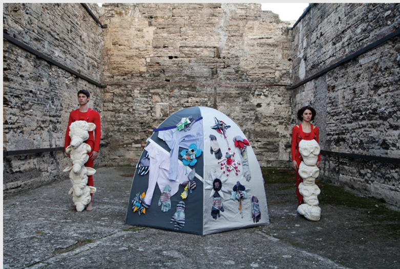
Fabulae Romanae Spirit – Myth Maker. 2012.

Algunas de sus series más significativas son Refuge Wear y Body Architecture , que desarrollan habitats portátiles y autónomos cuestionando la movilidad y supervivencia humana; Nexus Architecture , con prendas y complementos que configuran cuerpos modulares y colectivos; y Life Guards y Genius Loci , que desarrollan estructuras portátiles y representan la vulnerabilidad humana y la resiliencia.