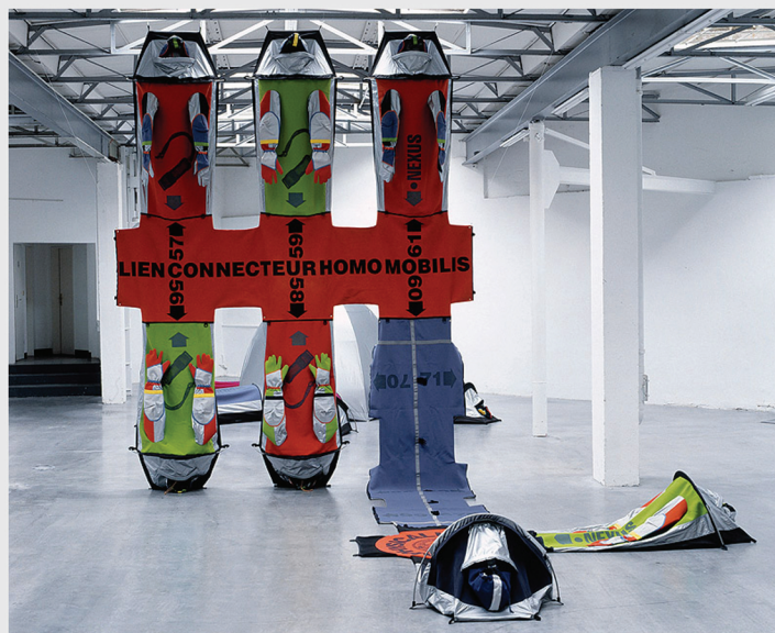
Connector Mobile Village II. 2001.

Imagen superior: Connector Mobile Village – Zhejiang Art Museum. 2000-2013.