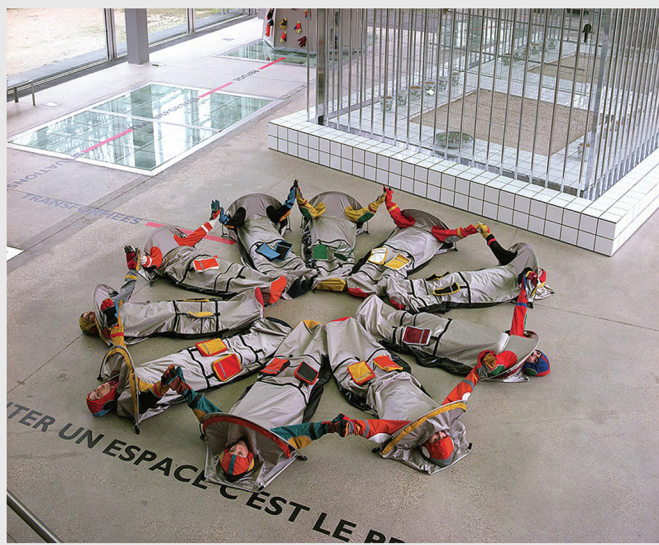
Modular Architecture – The Unit x 10, performance. 1996.

En la obra Body Architectures , Orta decidió cambiar el enfoque del microcosmos del individuo al macrocosmos de la comunidad y las viviendas modulares comunales, las cuales encarnan el principio de solidaridad tan presentes en la obra. ¿Para qué nos prepara Body Architectures ?