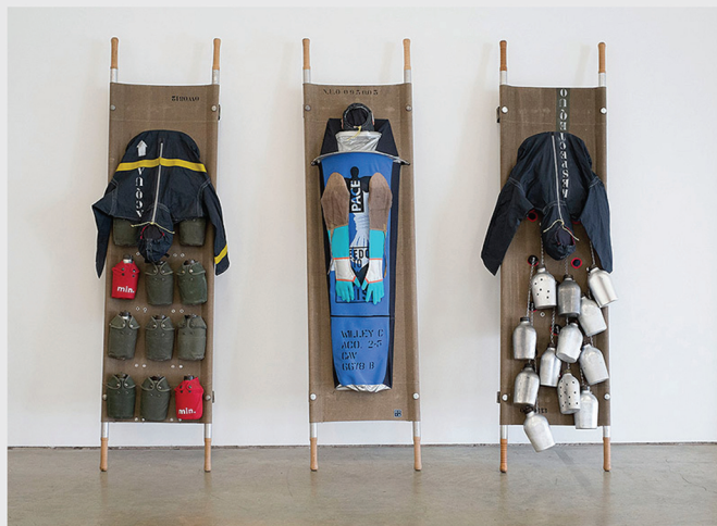
Life Guard #N.U.O. 2005.

Lucy Orta: Al principio comencé a trabajar en Body Architectures a mediados de los años 90 como respuesta a la fractalización de la sociedad, la descomposición de la unidad familiar tradicional y el aumento de la individualización. Era como una especie de antídoto contra la soledad, un medio para fomentar la reconexión con los demás. Además de las esculturas parecidas a tiendas de campaña, también ideé performances para explorar formas de conectar y construir espacios comunes.