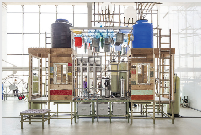
OrtaWater – Purification Factory Huang Pu river. 2012.

Las esculturas Life Guard Aira , Fuoco , Terra (Amazonia) y Acqua se inspiran en los cuatro elementos fundamentales: aire, fuego, tierra y agua representados en los frescos alegóricos de la Sala degli Elementi del Palazzo Vecchio de Florencia, donde se exhibieron por primera vez en 2019. Haciéndose eco de los dioses y divinidades mitológicas representados en los frescos, estos Life Guards están rodeados de una variedad de objetos simbólicos que hacen referencia a recursos cada vez más escasos: agua, aire limpio, energía, biodiversidad—y evocan la necesidad de desarrollar formas más sostenibles de usarlos, protegerlos y conservarlos en el futuro. Sigo creando nuevos Life Guards porque creo en la capacidad humana de prestar ayuda allí donde más se necesita.