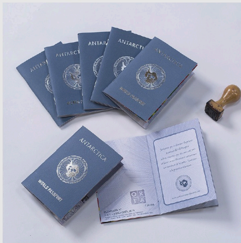
Antarctica World Passport, 2008.

El siguiente gran proyecto nuevo será "Traces: Stories of Migration" , cuyo objetivo es unir los recuerdos y experiencias de mujeres de comunidades étnicamente diversas para crear obras de arte basadas en textiles que revelen y celebren los patrones tejidos por los migrantes sobre sus viajes en el tapiz de sus comunidades.