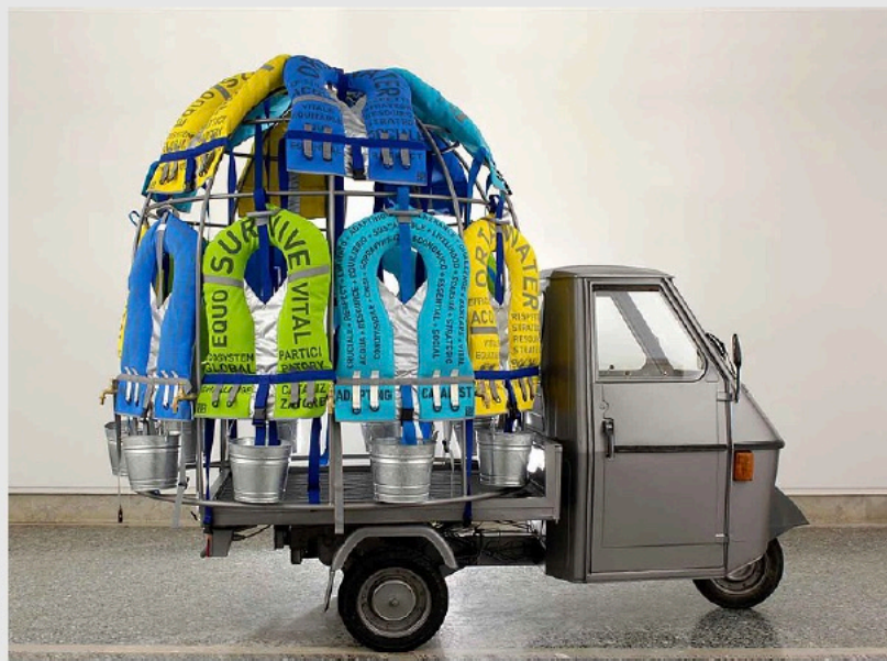
OrtaWater - M.I.U. Mobile. Intervention Unit (Ape). 2005.

Amazonia Tree of Life (2013), Arboreal (2015), Seeds (2016) o Masks (2020) son algunas de tus colecciones realizadas en cristal de Murano. ¿Qué hace que este material sea tan especial para ti?